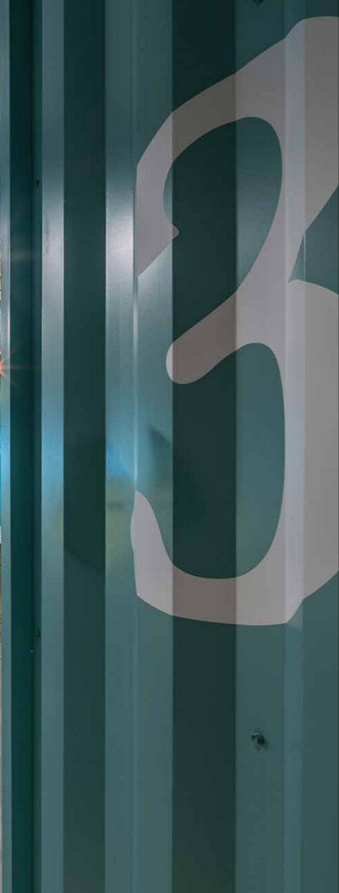
פינות החמד בין המכולות יצרו חללים אינטימיים לסיעוד מוחות ושיתוף פעולה בין הצוותים

העובדים והתרבות הארגונית הרצויה. היצירתיות הרבה של הסטודיו, המתכנן בעיקר שטחים גדולים של משרדים וחברות גדולות, באה לידי ביטוי בפתרונות ספציפיים ודינמיים התפורים לכל חברה ויודעים להביא חידושים מעוררי השראה. בעלת הבית, מנהלות הפרוייקטים, הלקוחות בארץ ובחיל, יחסי הכוחות, צעירות ובוגרות, הפרגון, הקשיים, הציפיה והתוצאות שמדברות בעד עצמן... נתוני הפתיחה היו: מבנה תעשייתי דל במערכות אלקטרוניקה, חשמל ותקשורת, ומשתרע על שטח של 3000 מ"ר. את הנתונים האפוריים האלה היה על גינדי סטודיו להפוך למקום עבודה אטרקטיבי. מתוצאות דיאלוג ושיח מתמשך עם העובדים בצירוף בקשות ספציפיות של הלקוח וניסיון מקצועי של גינדי סטודיו, היה ברור שהחלל העצום חייב לגדול, ושעליו להיות מורכב מכמה מאפיינים המותאמים לתוצאות המחקר המקדים שנערך טרם נקבע אופי העיצוב של המקום. בד בבד עם יצירת חללי עבודה שקטים