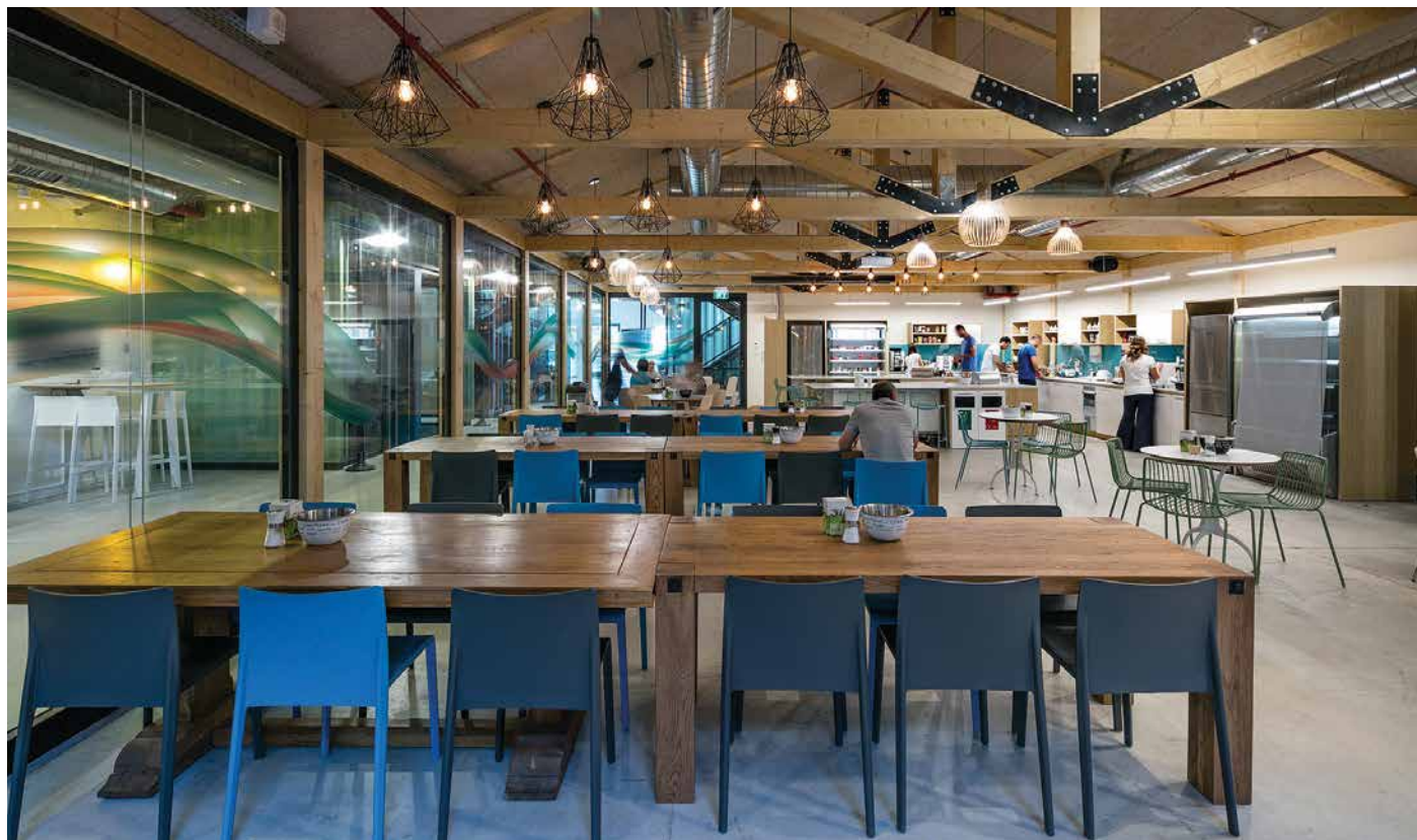
מבנה העץ (מבנה בתוך מבנה) שהוקם במרכז ההאנגר, הוא ה"פיאצה" של המקום. חלל התכנסות לכלל עובדי החברה והמקום האהוב על העובדים