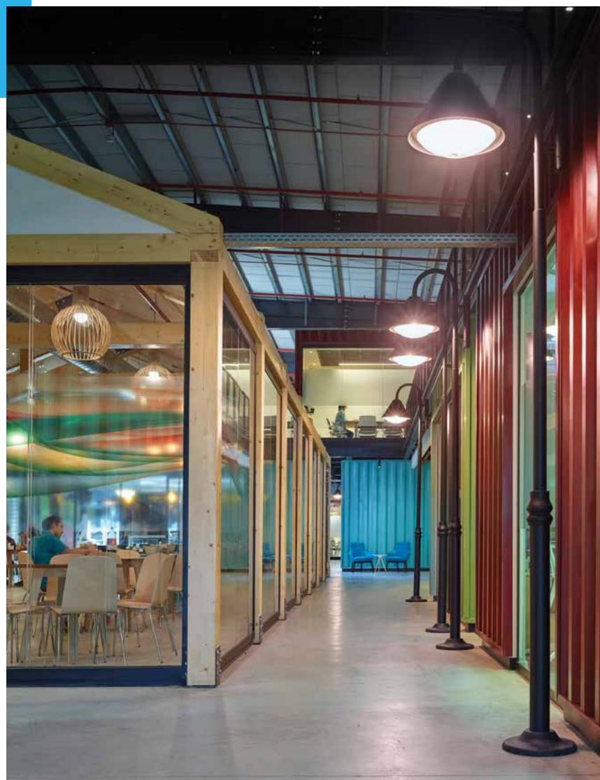
המסדרונות הראשיים הפכו ל"רחובות" על ידי שימוש חכם בגופי תאורה, טקסטורות וצבעים

לצד המכולות המבודדות אשר בהן שורר השקט הנדרש לכתיבת קוד, באזורים הציבוריים הססגוניים שמעניקים תחושת קהילה ושיתופיות, עוצבו חדרי התקהלות המיועדים לפגישות יזומות ומזדמנות. גורם משמעותי ביצירת אווירה נכונה הוא התאורה, טבעית ומלאכותית. בנוסף לסקיילינג הגדול שנפער במרכז הגג המשופע, נפתחו חלונות היקפיים סביב הגלריה. באור המלאכותי בולטות שתי מגמות, תאורה טכנית וממוקדת בפינות העבודה ותאורת אווירה שמתבטאת בגופי תאורה הלקוחים מעיצוב מסעדות, וכמובן פנסי רחוב שיחד יוצרים אווירה חמה ונעימה בחלל שעד לפני זמן קצר היה האנגר אפרורי ומשמים. ■